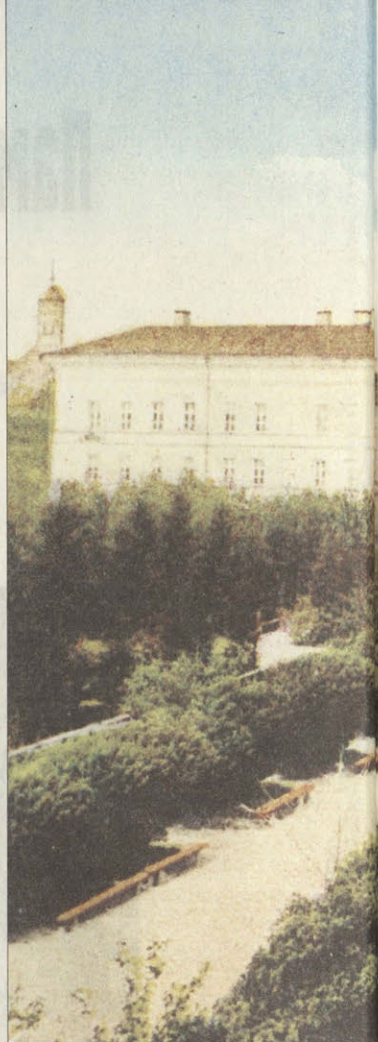
Симбирскъ. Общій видъ.

Старый Венец служит любимым местом не столько для прогулки обывателей, сколько для созерцания дивной картины, открывающейся с высоты его видов на величаво плывущую Волгу и лесистое Заволжье, уходящее за необъятный горизонт. В особенности весной каждый вечер Венец усеян зрителями: сидят