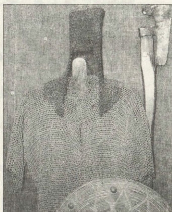
Кольчуга и головной убор мисюрка восточной работы Бердыш, восточный щит

Очевидцем «сего позорища» был сын симбирского дворянина Иван Дмитриев. Будущему баснописцу — «русскому Лафонтену», как его называли в зрелые годы, — было тогда 14 лет. Впоследствии И.И.Дмитриев поведал об этом Пушкину, который использовал его рассказ в «Истории Пугачевского бунта».