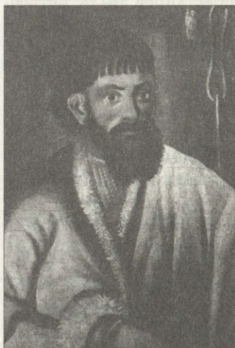
Е.И.Пугачев Холст, масло Копия с портрета написана в Симбирске в 1774 году

вольными, устанавливалось управление казачьего круга.