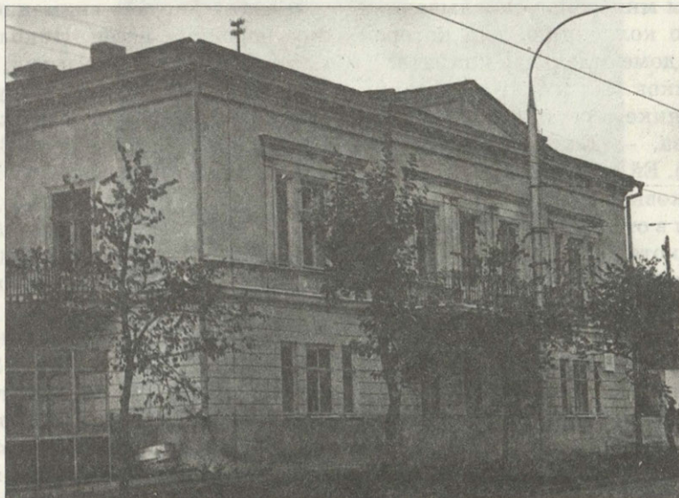
Дом Языковых Современный вид