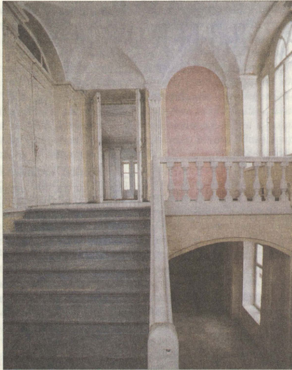
Бывший дом братьев Языковых Парадная лестница

увлечения. Его страстью была палеология, изучение почв и ископаемых Симбирской губернии. В столичном «Горном журнале» и в газете «Симбирские губернские ведомости» появляются его публикации, а собранные им в Поволжье образцы минералов складываются в обширную коллекцию, для которой отводится в доме отдельная комната.