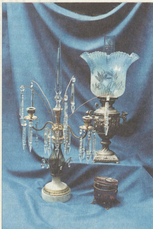
Жирандоль. Керосиновая лампа XIX век