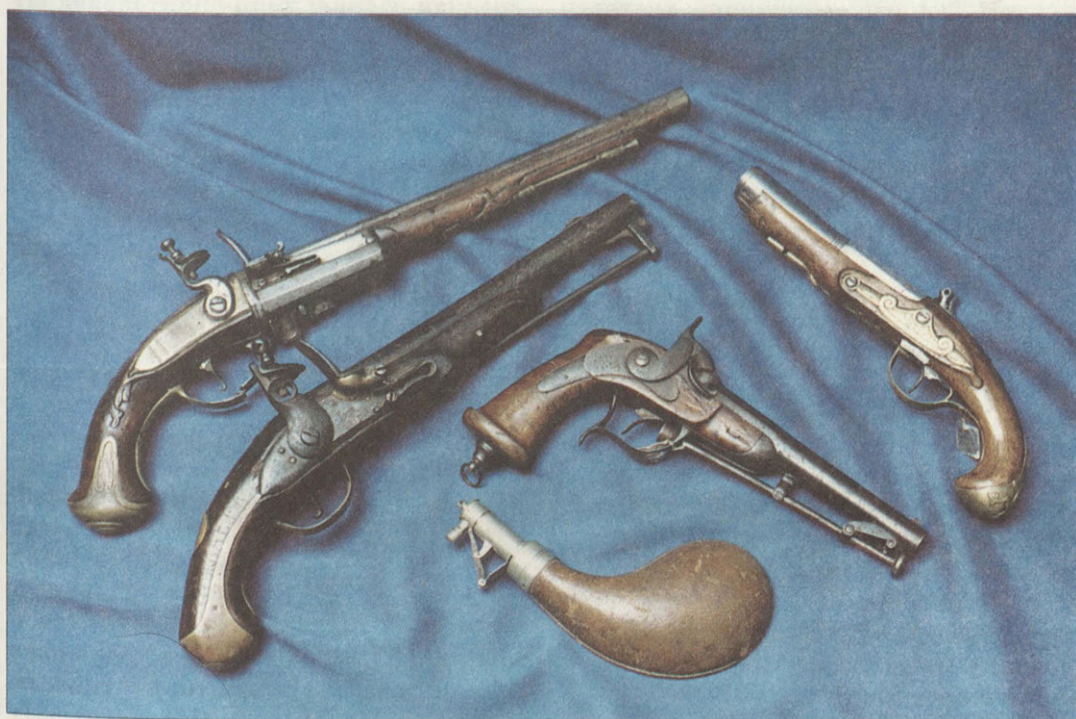
Пистолеты с ударно-кремневыми и капсюльными замками