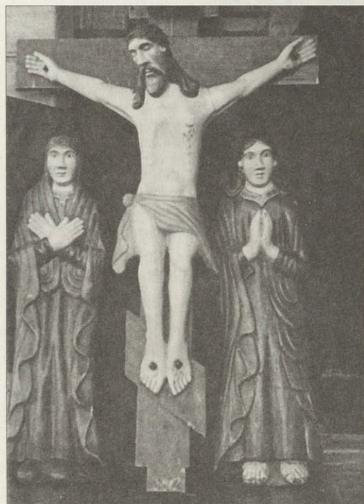
Распятие с предстоящими Церковная собственность