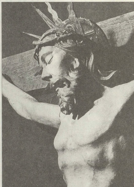
Распятие из церкви в селе Засарье Около 1763 года Фрагмент