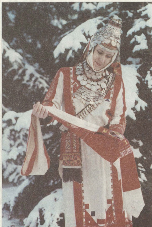
Чувашка в праздничном костюме с сурпаном в руках

калфаки, ичиги, нагрудные украшения — «кук-ракчи», а так же ювелирные украшения.