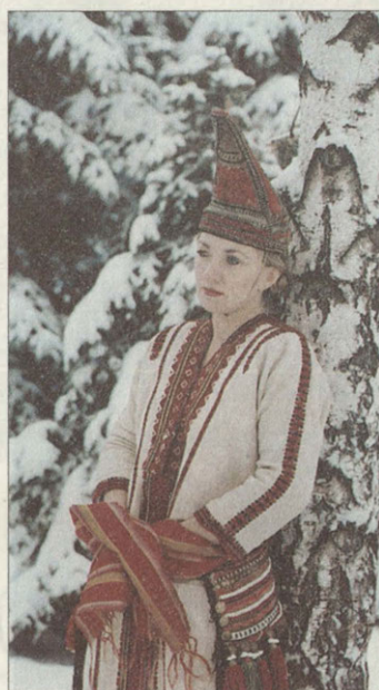
Мордовка-эрзянка в головном уборе «панго»

Чуваши — третья по численности этническая группа Ульяновской области. Она составляет 8,3 процента ко всему населению. На территории Ульяновской области проживают преимущественно чувашки анатри. В этнографической коллекции музея комплекс чувашской одежды представлен наиболее полно. Это богато украшенные головные полотенца — сурпаны, поясные украшения, нагрудные украшения, головные уборы,