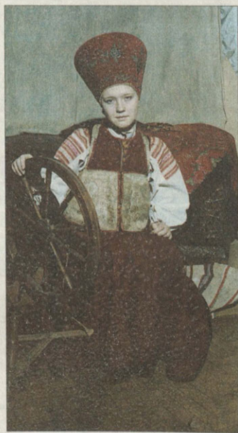
Кокосник-шапочку надевали во многих русских селениях в девятнадцатом веке

хи и порты — ткань в полосу. Под сарафаном носили рубаху — «рукава». Из головных уборов широко бытовали в XVIII веке кокошники владими́ро-яросла́вского типа, богато декорированные, из бархата. В коллекции музея — восемь таких кокошников. Также встречались кокошники-шапочки, которые стали преобладать в XIX веке. В коллекции музея два таких кокошника. Позднее кокошники были вытеснены праздничными платками. Мужское население носило рубахи и пестрядинные порты. Из верхней одежды распространены были стеганые поддевки, кафтаны, зипуны, армяки, чапаны, щубняки, шубы, тулупы.