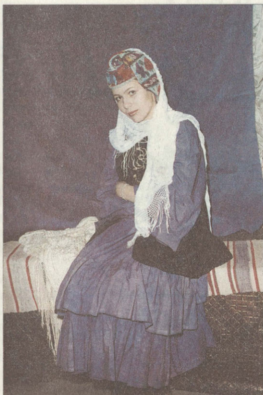
Праздничная одежда симбирской татарки