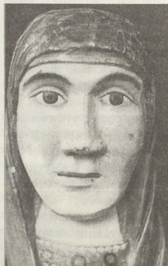
Богоматерь XVIII век Фрагмент