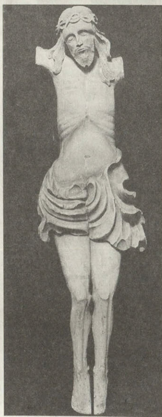
Распятие из села Оськино XVIII век