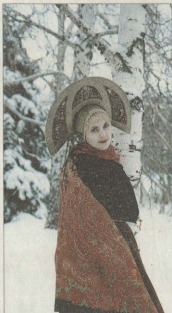
Кокосники владими́ро-яросла́вского типа широко бытовали в восемнадцатом веке

У русских женщин в прошлом распространен был комплекс одежды с сарафаном. В XVIII веке носили распашной косоклинный сарафан, в девятнадцатом — прямой, московского типа, на лямках, шестиклинный. В коллекции музея имеются прекрасные образцы ситцевых «кубовых» сарафанов, а также домотканые; один из них — пестрядинный из «промзинки», тканой в селе Промзино (ныне рабочий поселок Сурское). Эта ткань широко продавалась на ярмарках и не только в Симбирской губернии. На сарафаны, как правило, шла «клетка», а на мужские руба-