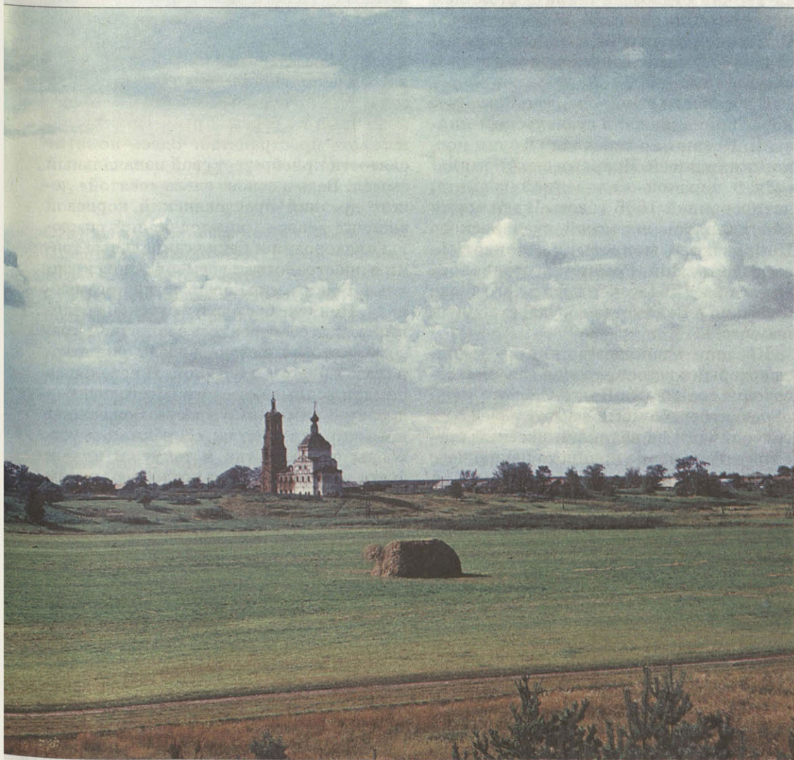
Вид на село Добрыньское

Туристы, приезжающие в Суздаль и восхищающиеся его памятниками, даже не подозревают, что рядом находятся не менее выдающиеся образцы