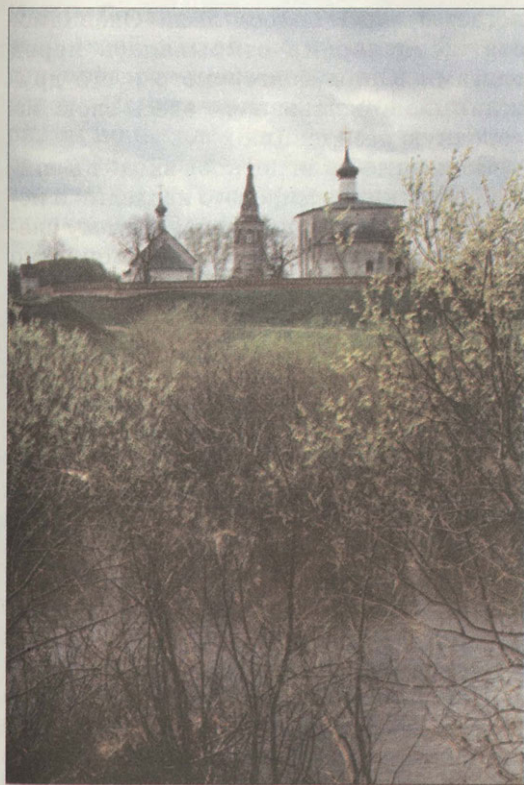
Кидекша Весна вступила в свои права