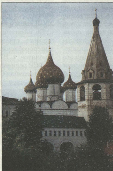
Не гаснут звезды на куполах Рождественского собора

Памятник представлял собой для Владимиро-Суздальской земли в разные периоды уникальный образец почти по всем направлениям храмового строительства. Начиная с собора Мономаха, он был первым кирпичным зданием и первым городским собором (кафедральный деревянный находился в Росто-