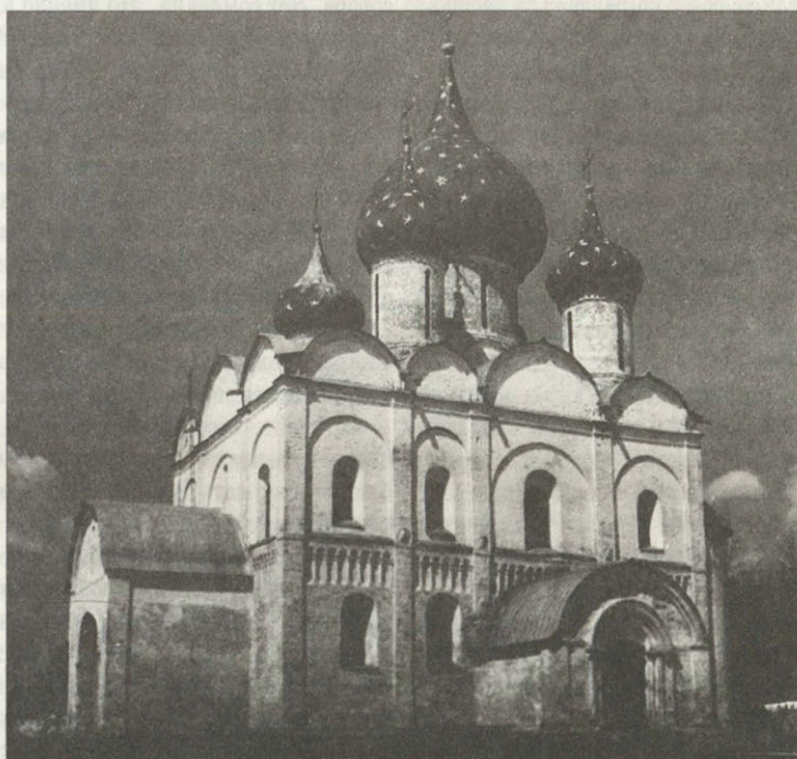
Древнейший собор города — разные веки его судьбы