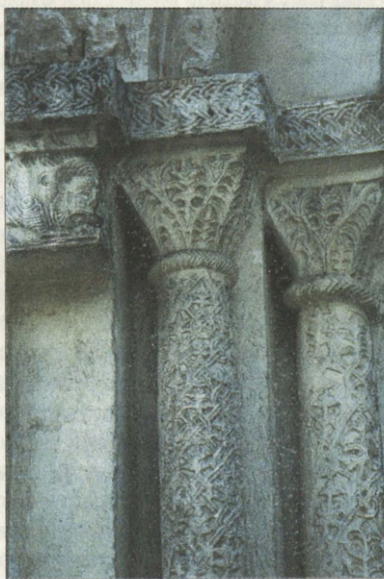
Фрагмент резьбы портала

В 2001–2004 годах исполнится 900 лет со времени строительства первого кирпичного здания в Залесской земле. Суздальский собор является яркой иллюстрацией для энциклопедии строительного дела Руси, сохраняя в себе элементы материальной и строительной культуры с начала XII по XIX век. Но сохранится ли все это к юбилею? В результате деструктации белого камня резьба исчезает буквально на глазах, а расчленение кладки ставит памятник на грань очередного разрушения. К сожалению, эти слова можно отнести ко всему владимиро-суздальскому зодчеству домонгольского периода. Делу государственного значения нужна государственная забота.