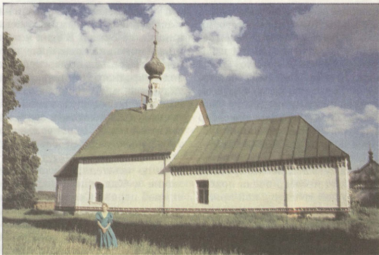
Кидекша Старая церковь — новый приход

куполах, украшенный уникальной белокаменной резьбой XIII века снаружи, с богатыми работами древних мастеров интерьерами внутри. И такому чуду угрожает обрушение! Внутрь собора теперь уже не войдешь, да и близко подходить возбраняется. Ведутся аварийные работы, из-за безденежья, конечно же, совершенно недостаточные для радикального решения проблемы.