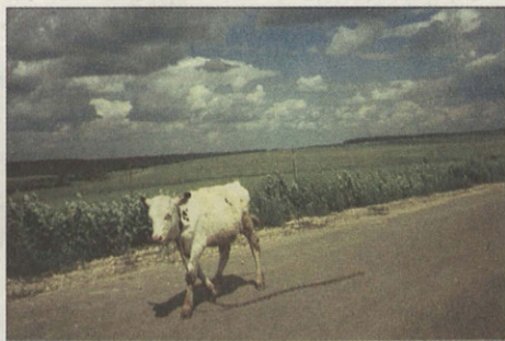
На этой дороге привольно всем

лучшего места для спасения от убийственной суеты и спешки больших городов, для отдыха души и приобщения к вечным ценностям, — трудно себе представить.