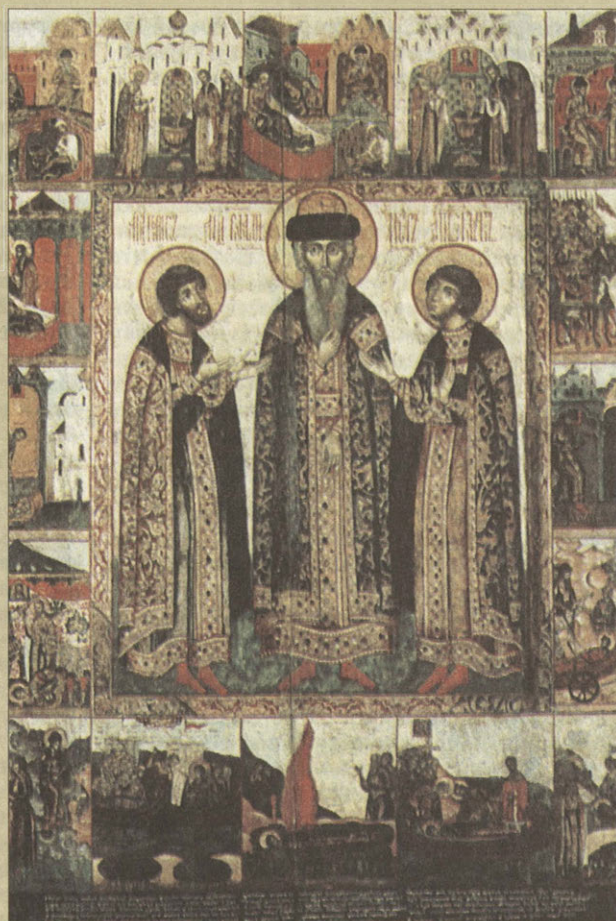
Борис, Глеб, князь Владимир XVII в.