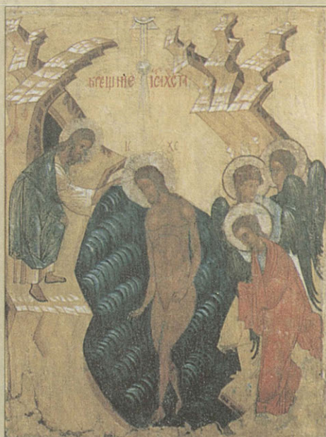
Богоявление Конец XV в.