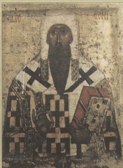
Митрополит Алексей XV в.