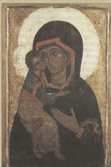
Богоматьерь «Умиление» XIV в.