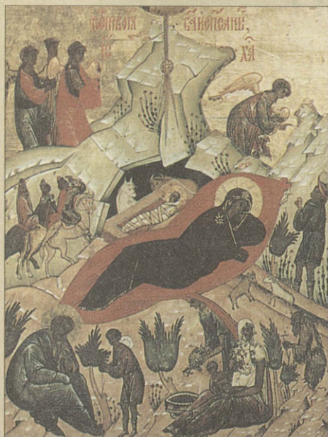
Икона-таблетка «Рождество Христово» XVI в.