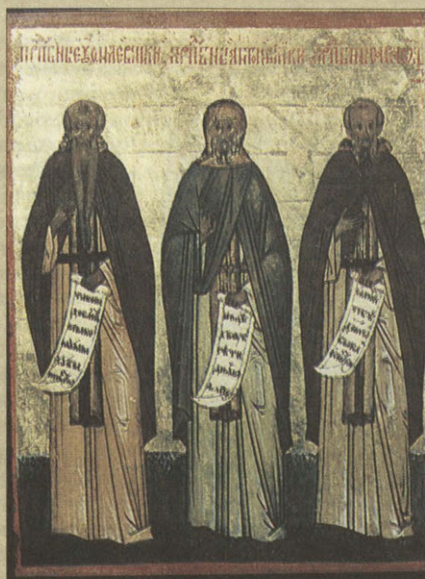
Икона-таблетка «Избранные святые»