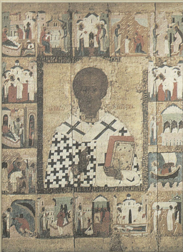
Никола в житии Начало XVI в.