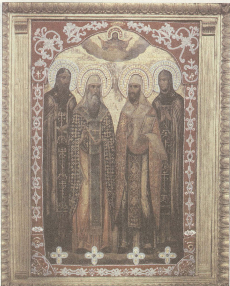
Суздальские святые: Евфимий, Феодор, Иоанн, Евфросиния

В день памяти св. Феодора 21 июня в последние годы стали совершаться крестные ходы от собора Рождества Богородицы в Свято-Васильевский мужской монастырь.