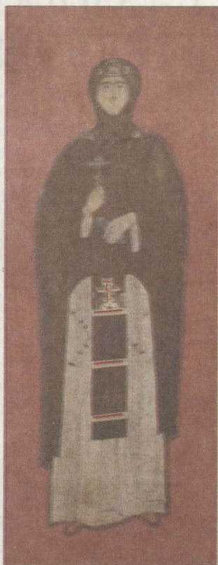
Покров с изображением Евфросинии Суздальской. XVI век