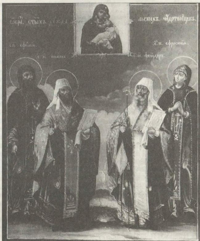
Икона «Суздальские чудотворцы» 1792 г.