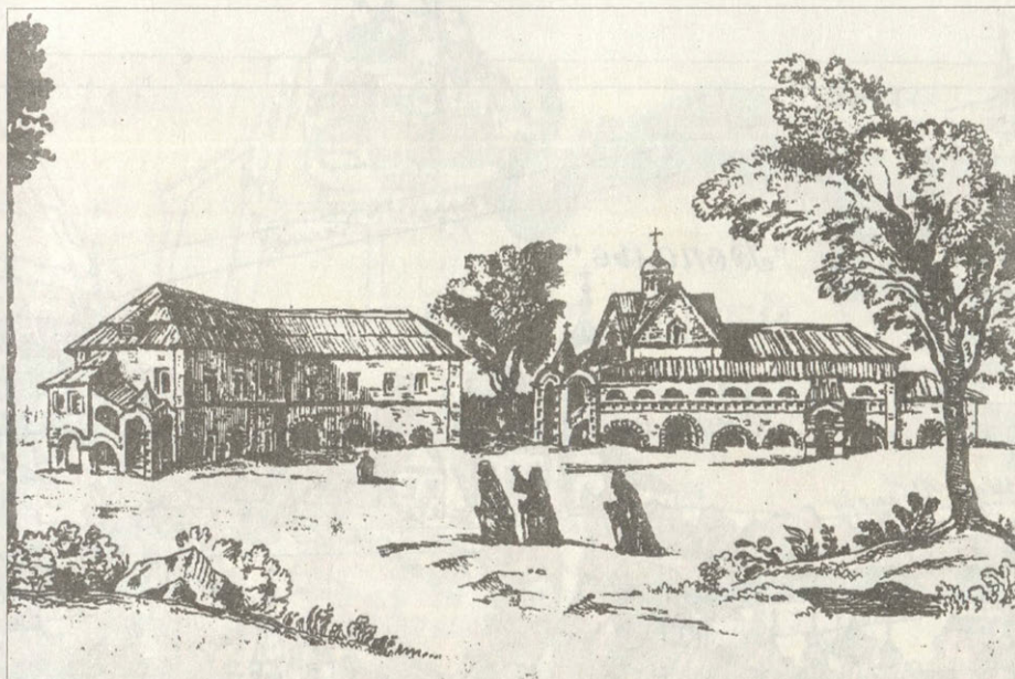
Архиерейский двор в XVI в.