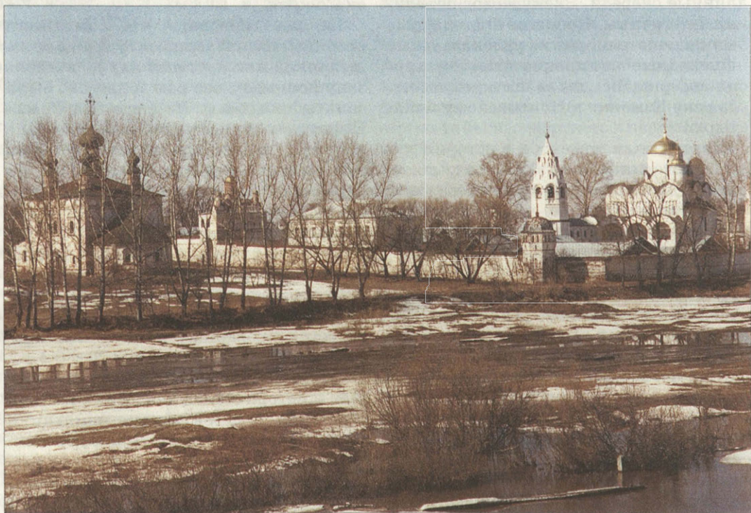
Весна. Половодье. Покровский монастырь