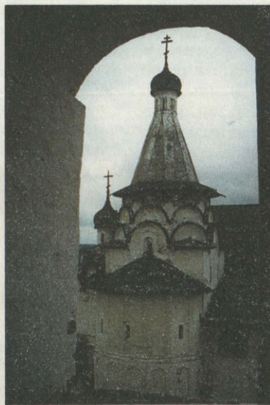
Успенская трапезная церковь Спасо-Евфимиева монастыря

А в Суздале сохранены и достойно содержатся три мощных музейных «бастиона» — Суздальский кремль, Спасо-Евфимиев монастырь и музей деревянного зодчества. Растет поток туристов. Особенно радуется, что детей в музее становится все больше, даже если сравнивать с годами самой высокой посещаемости.