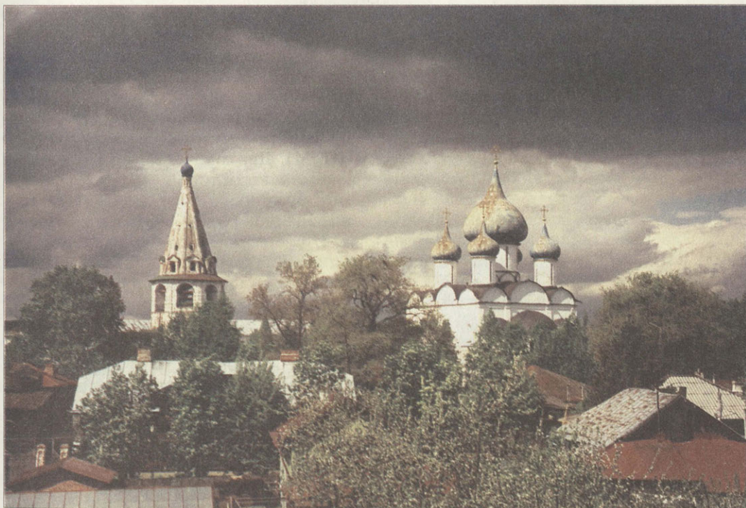
Кремль Рождественский собор

дворе Суздальского кремля стояли длинные очереди. Экскурсовод объединял 2–3 группы. Но какие благодарные были слушатели, какие увлекательные пешеходные четырехчасовые экскурсии совершались по валам кремля, через реку Каменку к Покровскому монастырю!