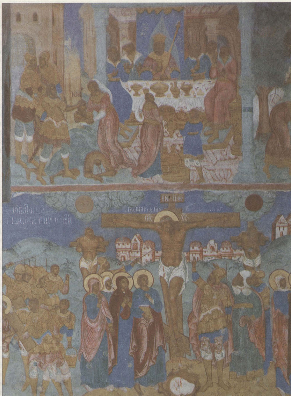
Фреска Гурия Никитина

перед нами, под записями Сафонова, произведение именно этого художника. Было очевидно, что запись повторяла первоначальные композиции и рисунок, можно было составить представление об иконографическом составе росписи. Я поделилась своими догадками с моими спутниками, и это вызвало большой интерес.