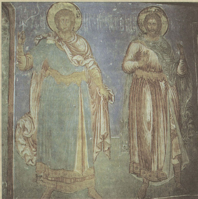
Фрагменты росписи Преображенского собора Спасо-Евфимиева монастыря XVII в.