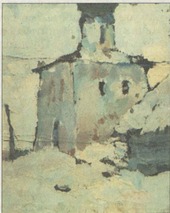
В.Кнюков Тихвинская церковь

Разные художники, разные творческие судьбы, разные манеры и пристрастия, но одно у них общее — преданность и любовь к Суздалю.