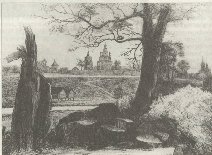
В.Мырин «Суздальский этюд» Офорт