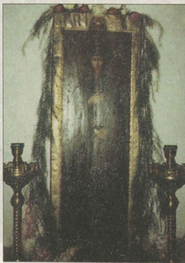
Икона св. Софии Суздальской XVIII в.

До нас дошел образ Софии, написанный на гробовой доске, во весь рост. Он находился у гробницы инокини Софии. Сейчас образ находится в Покровском соборе. Известна также икона Божией Матери с предстоящими Соломонией и Василием III. Икона, очевидно, принадлежала Соломонии. Она находится в Спасо-Андрониковом монастыре. Возобновление богослужений в Покровском монастыре (1992) позволило восстановить почитание св. Софии, утраченное в годы лихолетья. В день Происхождения честных древ Животворящего Креста Господня, когда празднуется и память семи мучеников Макковеев и матери их Соломонии, в день тезоименитства Соломонии 13 августа 1995 года было совершено торжественное богослужение по случаю возрождения почитания Святой Софии. Крестный ход превратился в общегородской праздник.