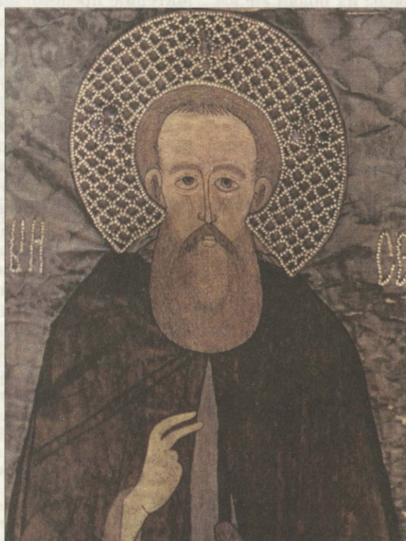
Сергий Радонежский Золотое шитье