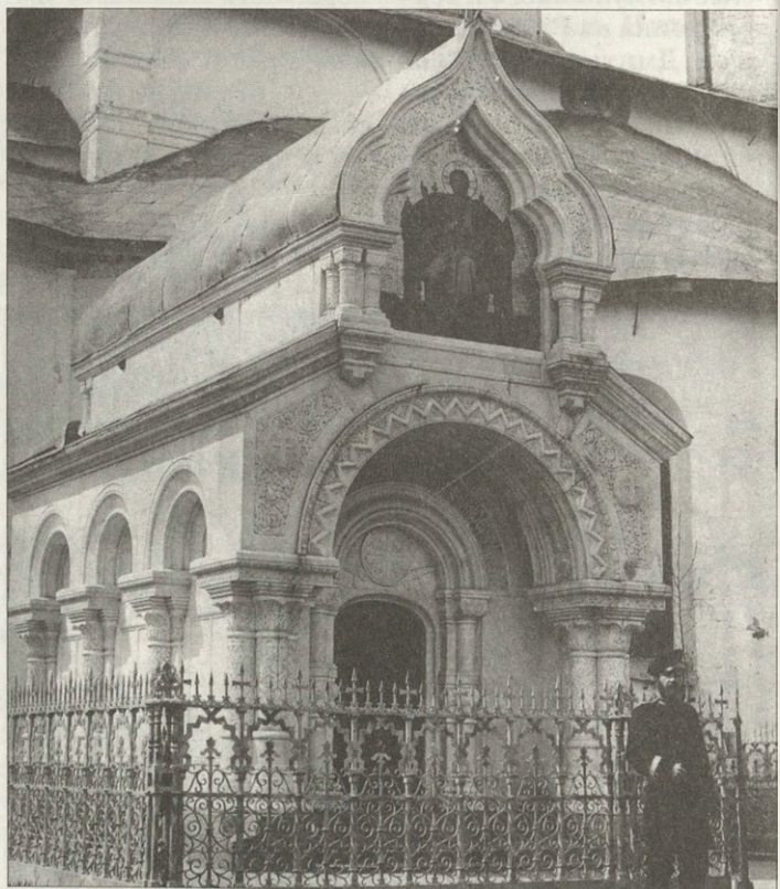
Мавзолей князя Д.М.Пожарского в Спасо-Евфимиевом монастыре. Начало XX в.

Погребение Д.М.Пожарского оказалось утеряно, и его память предана в монастыре забвению.