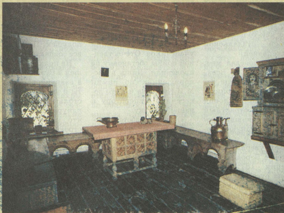
Чисто и уютно в крестьянской избе из села Лог Музей деревянного зодчества