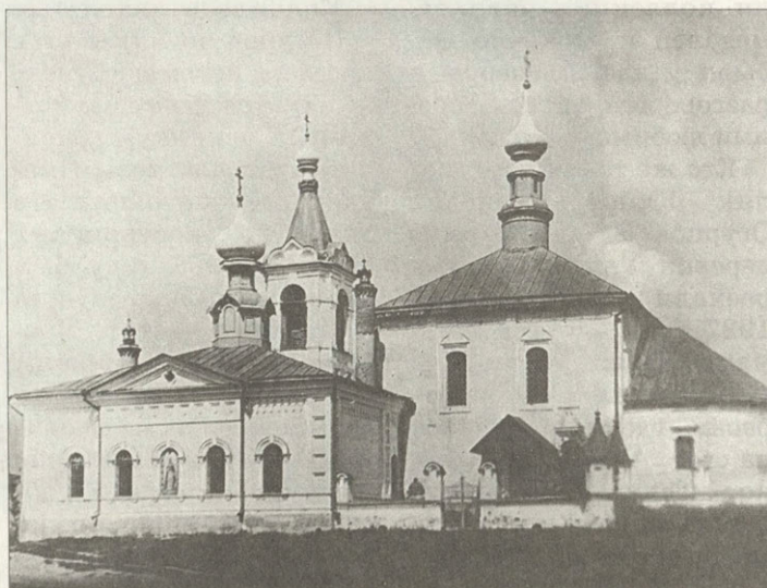
На старых фотографиях Петропавловская и Варваринская церкви — незадолго до разрушения