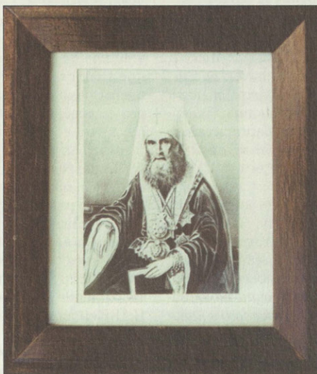
Митрополит Московский и Коломенский Филарет (Дроздов). Гравюра Ф.Алексеева. 1833 г.

Прекрасен и величествен образ игуменьи Марии, от него веет древней святостью. Но не будем, однако, забывать, что решающее значение в создании Спасо-Бородинского монастыря имело руководство и покровительство святителя Филарета Московского. Для игуменьи Марии он был поистине «отцом-благодетелем» (так величала его сама основательница обители).