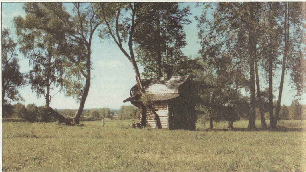
Часовня на могиле преподобной Рахили

кому житию в Спасо-Бородинском монастыре под руководством игуменнии Марии.