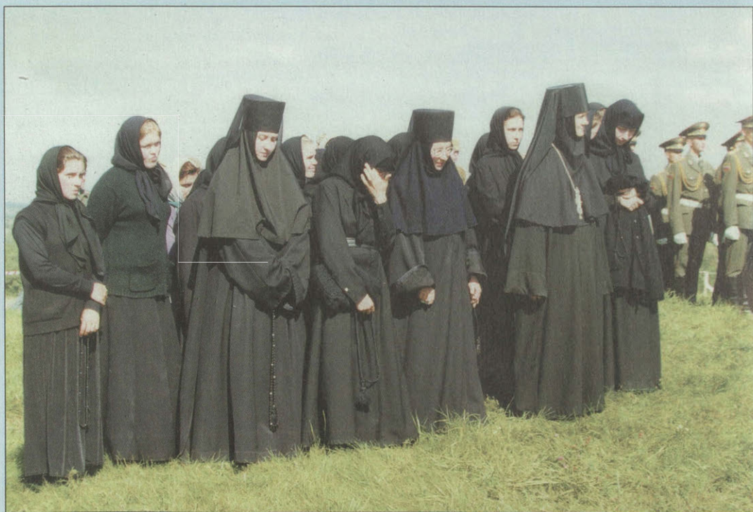
«День Бородина» 1999 г. Насельницы Спасо-Бородинского монастыря