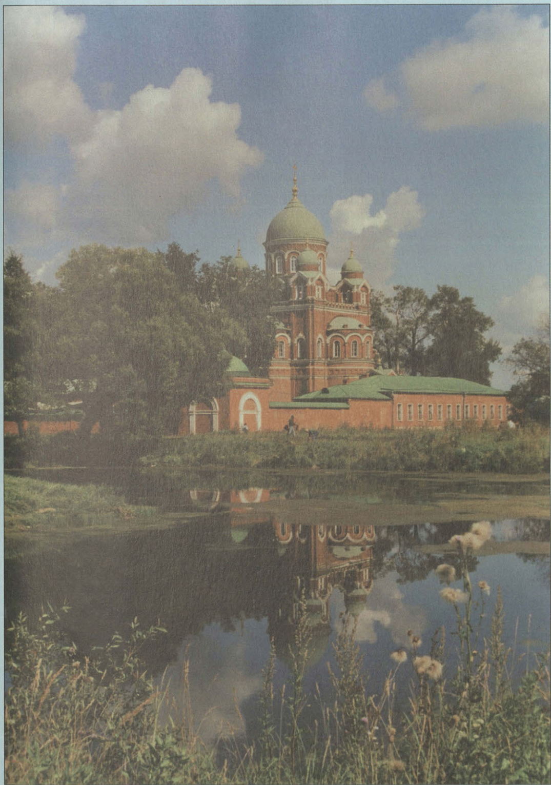
Собор Владимирской иконы Божией Матери Спасо-Бородинского монастыря. Архитектор М.Выковский.1851–1859 гг.