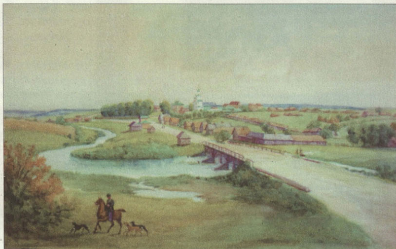
Вид на село Бородино от деревни Горки. Художник П.А.Нисевин, 1869 г. Акварель

В романе «Война и мир» Бородинское сражение описывается в двадцати главах. В них вошло то, что писатель узнал и увидел, передумал и прочувствовал. Споры о том, насколько детали этой эпической картины соответствуют исторической реальности, начались сразу после опубликования романа и будут продолжаться. Время подтвердило правомерность главного вывода, сделанного великим писателем: «Прямым следствием Бородинского сражения было беспричинное бегство Наполеона из Москвы, возвращение по Старой Смоленской дороге, погибель пятисоттысячного нашествия и погибель наполеоновской Франции, на которую в первый раз под Бородином была наложена рука сильнейшего духом противника».