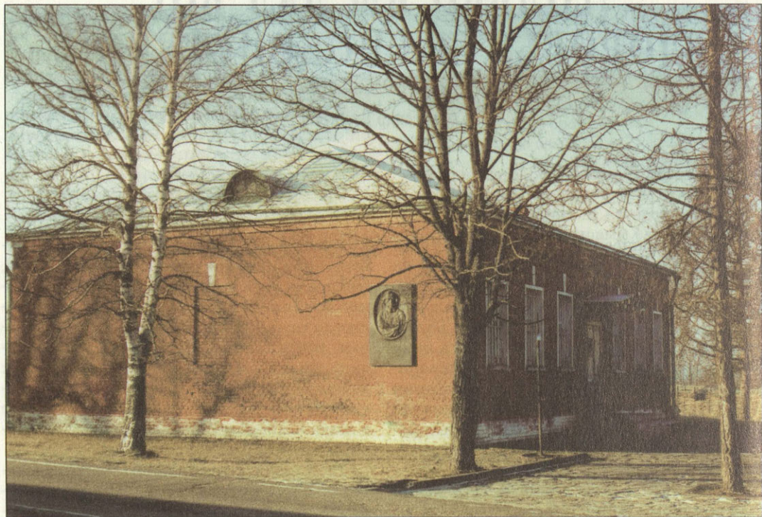
Здание гостиницы Спасо-Бородинского монастыря, в которой в 1867 году останавливался Л.Н. Толстой

15 августа 1863 года, мы видим исследование А.И. Михайловского-Данилевского о войнах 1805, 1812–1814 годов, «Историю консульства и империи» А.Тьера, «Записки артиллериста» И.Т. Радожицкого и другие книги, служившие Л.Н. Толстому основными источниками в течение всей работы над романом. Позднее он писал: «Везде, где в моем романе говорят и действуют исторические лица, я не выдумывал, а пользовался материалами, из которых у меня во время моей работы образовалась целая библиотека». Список этих книг включает 74 названия. Здесь воспоминания и исследования историков, художественные произведения, журналы эпохи 1812 года.