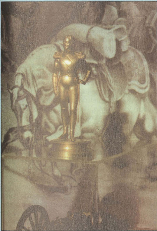
Александр I. Неизвестный скульптор. Первая половина XIX в. Публикуется впервые