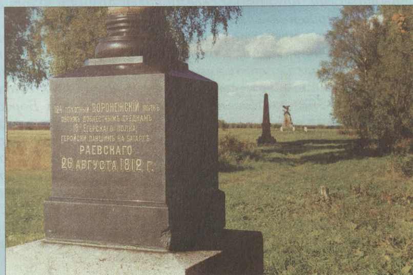
Памятники русским войскам на опушке Псарёвского леса.