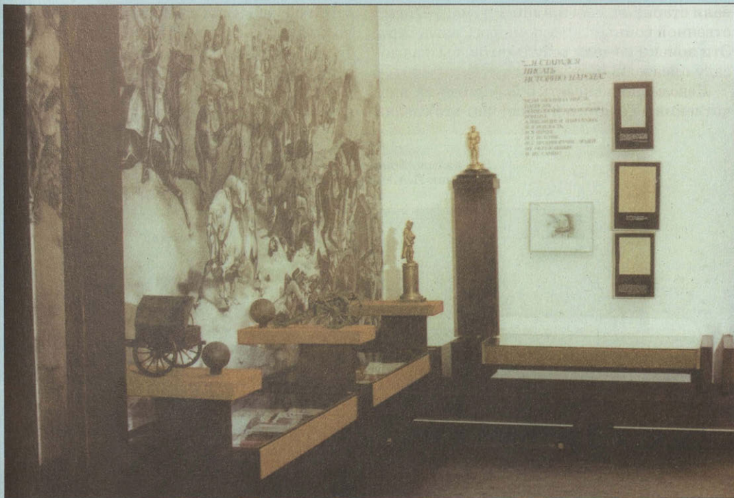
Фрагменты экспозиции «Л. Толстой и Бородинское сражение»