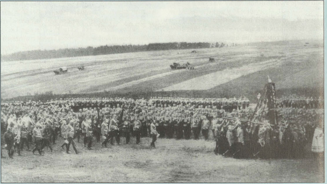
Крестный ход на Бородинском поле 26 августа 1912 г.