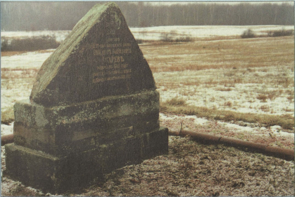
Могила капитана Лейб-гвардии Финляндского полка А.Огарёва, погибшего в Бородинском сражении