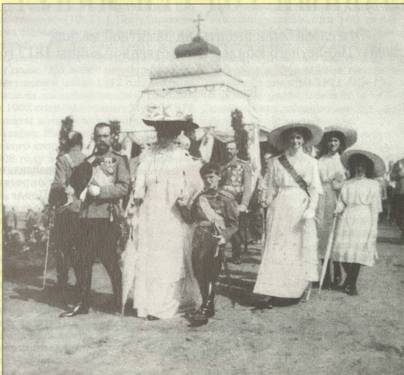
Царская семья на Батарее Раевского 26 августа 1912 г.