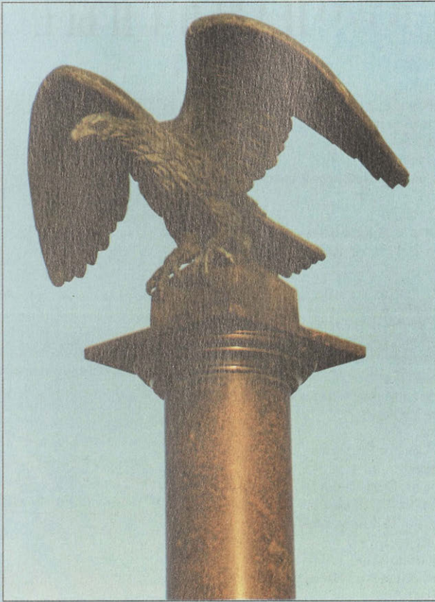
Фрагмент памятника Пионерным (инженерным) войскам. Архитектор неизвестен. 1912 г.