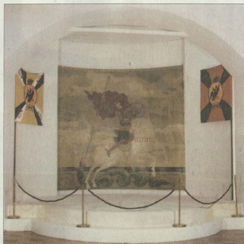
Святой Георгий Победоносец. Худ. В.Барвенко. 1987 г. Фрагмент экспозиции «Бородино. За Веру, Царя и Отечество»

Привлекают внимание посетителей своим шаржированным обликом необычные деревянные фигуры солдат профессионально-