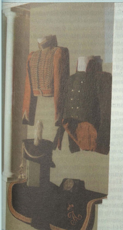
Фрагменты экспозиции «Бородино. За Веру, Царя и Отечество»