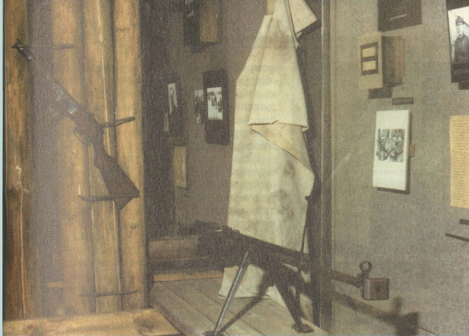
Фрагмент экспозиции «Бородино в годы Великой Отечественной войны»