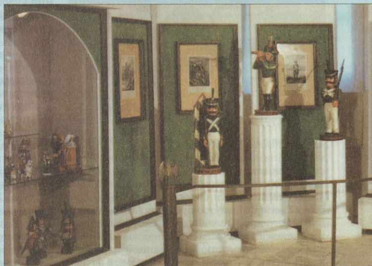
Фрагмент экспозиции «Военная художественная игрушка»