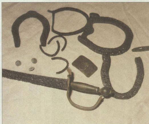
Находки с Бородинского поля сражения 1812 г.

го художника И.П.Вьюева. Его деревянные игрушки рассредоточены по всей выставке и поистине являются ее украшением. Художник в своем творчестве продолжает традиции народного промысла богородской и сергиевской игрушек.