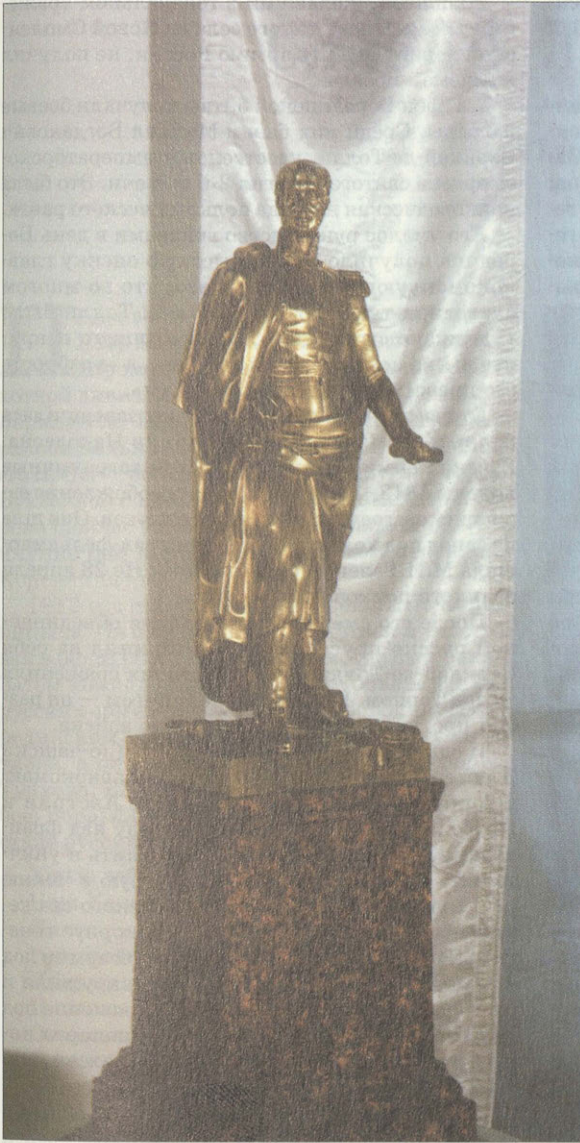
М.Б.Барклай-де-Толли. Скульптор Б.И.Орловский. 1836 г.

великим полководцем Наполеоном. Примером для него на этом поприще был Петр Великий, первый российский император из династии Романовых с полководческой славой.