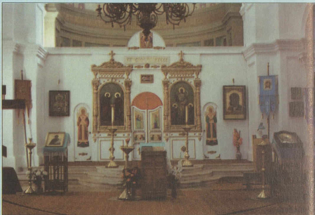
Интерьер Владимирского собора