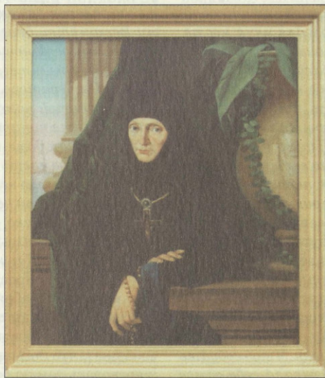
Игуменя Мария (Тучкова). Неизвестный художник. Конец XIX — начало XX вв.

Справедливости ради стоит отметить, что мысль о сооружении новой церкви на Бородинском поле для молитвенного поминовения убиенных воинов возникала в уме графа Федора Васильевича Ростопчина. В одном из писем от 24 сен-