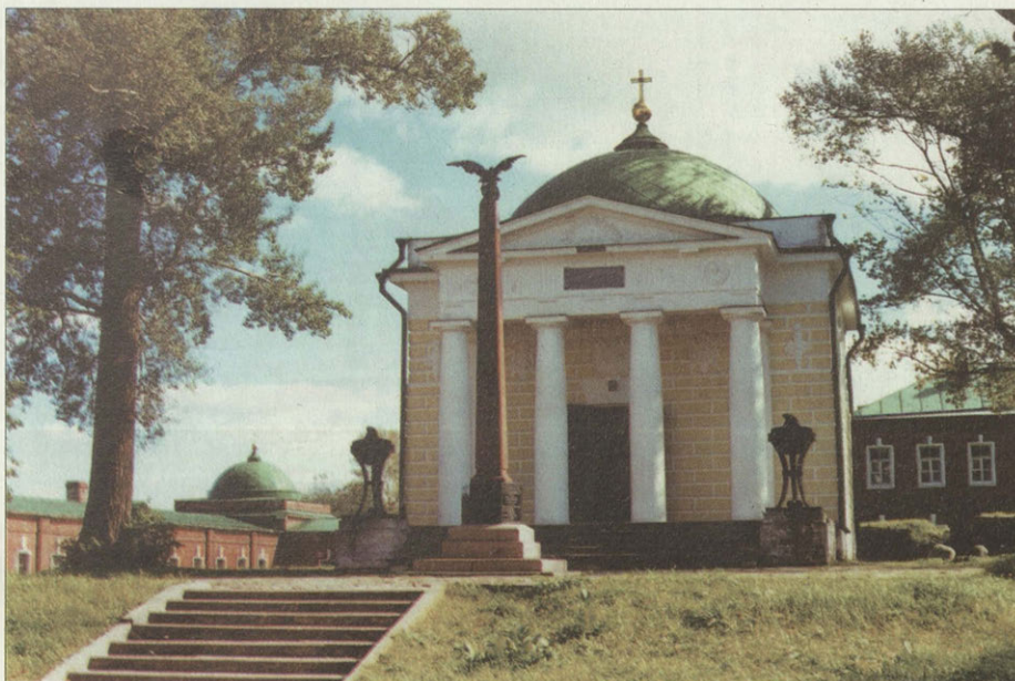
Церковь Спаса Нерукотворного — усыпальница Тучковых. Архитектор неизвестен. 1820 г.