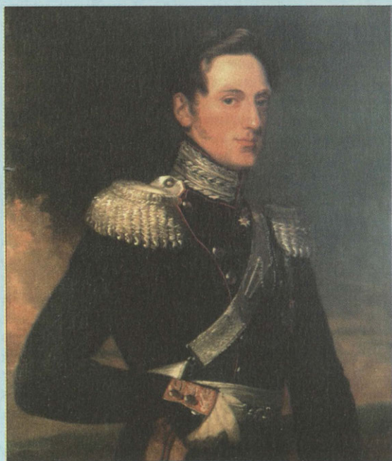
Император Николай I. Художник Д.Доу. 1820-е гг.

Р ебята! Перед вами памятник, свидетельствующий о славном подвиге ваших товарищей!