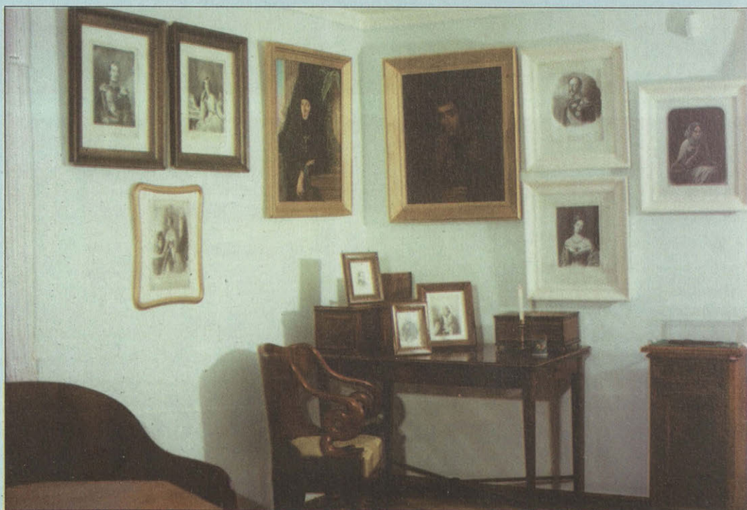
Интерьер кабинета-гостиной в доме игуменьи Марии