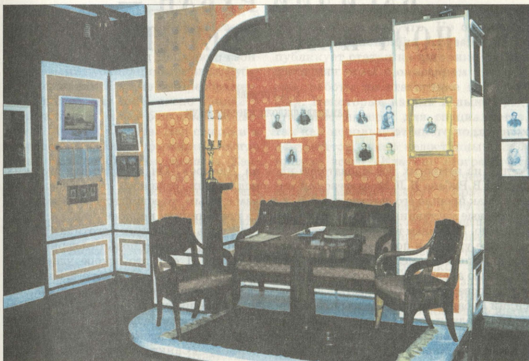
Уголок музея М.С.Щепкина

под венца с мужем-крепостным. Экспозиция следующего зала рассказывает о становлении Щепкина-актера на провинциальной сцене. Он играет сам и ставит спектакли в Курске, Харькове, Полтаве, Сумах, выступает на ярмарках и в господских домах. Атмосферу провинциальной театральной жизни помогает почувствовать интерьер ярмарочного балагана. Здесь и афиши, театральная бутафория, дорожный сундук, издания пьес, театральный костюм к опере «Наталка-Полтавка».