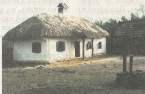
Крестьянская усадьба Реконструкция

верхоглядству, от него немало доставалось дилетантам, невзирая на чины и звания. Даже своих сыновей он не выпустил на сцену, почитав уровень их артистических способностей недостаточным для фамилии «Щепкин».