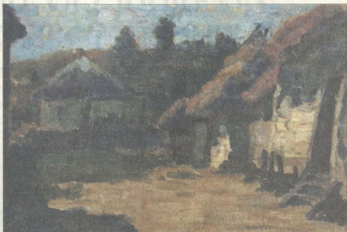
Окраина Белгорода. Этюд М.А.Курбатова