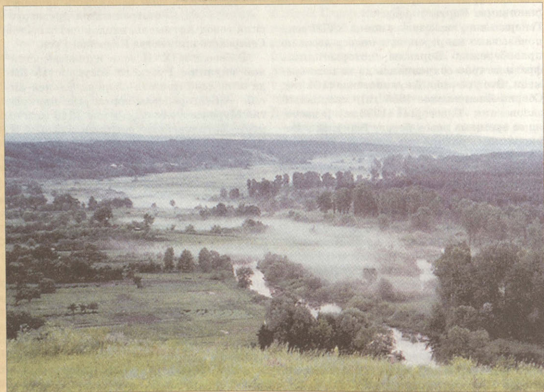
Вид на урочище «Красиво» с Хотмыжского городища