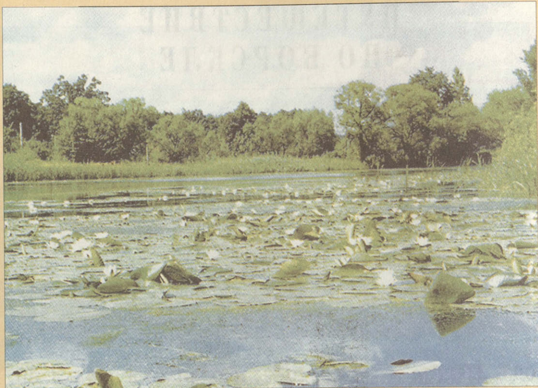
Белая кувшинка (нимфей) на Ворскле