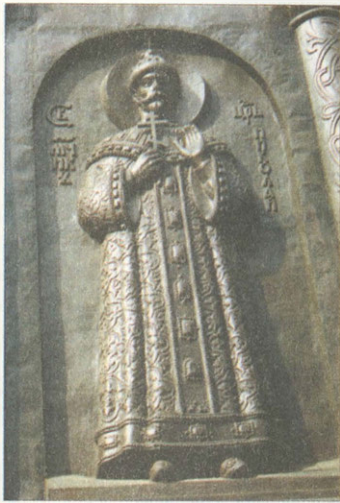
Царь-мученик Николай II