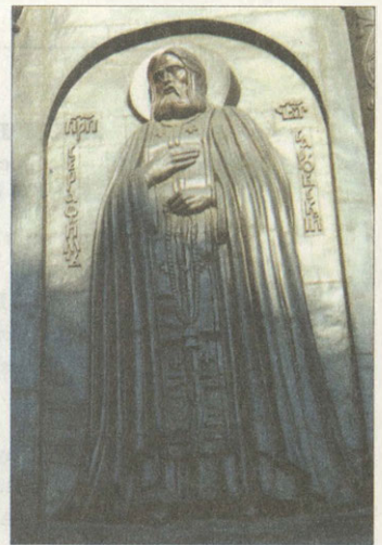
Преподобный Серафим Саровский

день памяти которых, 12 июля 1943 года состоялось знаменитое Прохоровское танковое сражение. По краям горельефа находятся фигуры особо почитаемых на Руси святых воинов — Георгия Победоносца и Дмитрия Солунского.