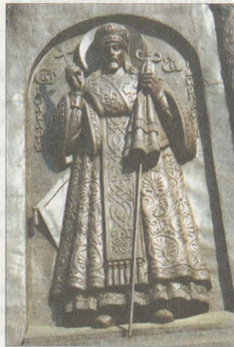
Святитель Иосаф Белгородский