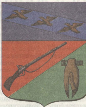
Герб города Старый Оскол