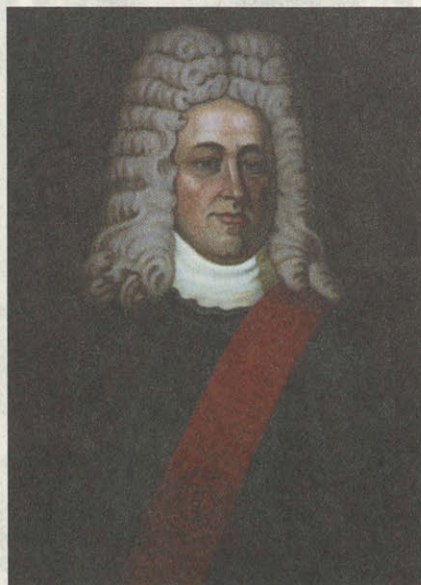
Первый Белгородский губернатор князь Ю.Ю.Трубецкой

Первым белгородским губернатором стал князь Юрий Трубецкой. Структура управления выглядела следующим образом: губернатор, товарищ