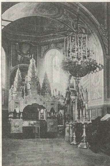
Сень над ракой свт. Иоасафа. Начало XX в.