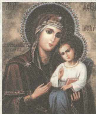
Песчанская икона Божией Матери

Грозные слова святителя исполнились в разразившейся войне. Было затем и второе видение Святителя. Но теперь он сказал: «Поздно... Только одна Матерь Божия может спасти Рос-