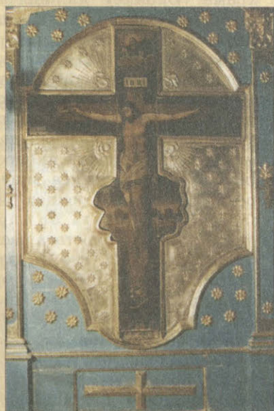
Иконостас храма Воскресения Христового, с. Зимовенька Шебекинского р-на