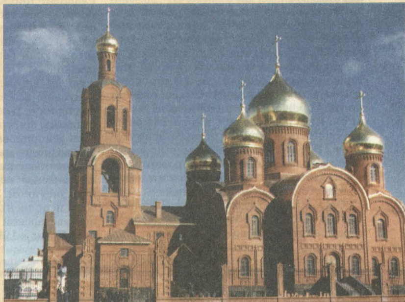
Спасо-Преображенский собор в г. Губкине