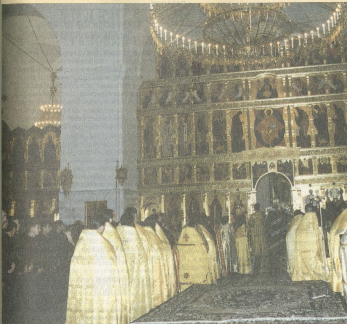
Иконостас Спасо-Преображенского собора