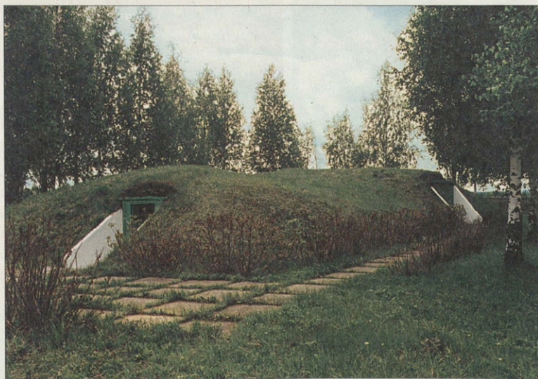
Наблюдательный пункт командующего 5-й гвардейской танковой армией П.А. Ротмистрова

Когда в ходе сражения возникла угроза прорыва на Прохоровском направлении, сюда, совершив 350-километровый бросок, подошла 5-я танковая армия. Ее штаб и тыловые части разместились в селе Скоровка, в 12 километрах от поселка. Основная ударная группировка армии сосредоточилась на окраинах Прохоровки в районе кирпичного завода и села Борщевка. Непосредственно на передовой для командующего армией был оборудован наблюдательный пункт. Он располагался в двух километрах северо-западнее поселка на высоте 252,4, где когда-то был насыпан древний курган. Отсюда хорошо просматривались окрестности. 12 июля 1943 года вместе с командармом с этого места наблюдал за ходом танкового боя начальник Генерального штаба Красной Армии Маршал Советского Союза А. М. Василевский.