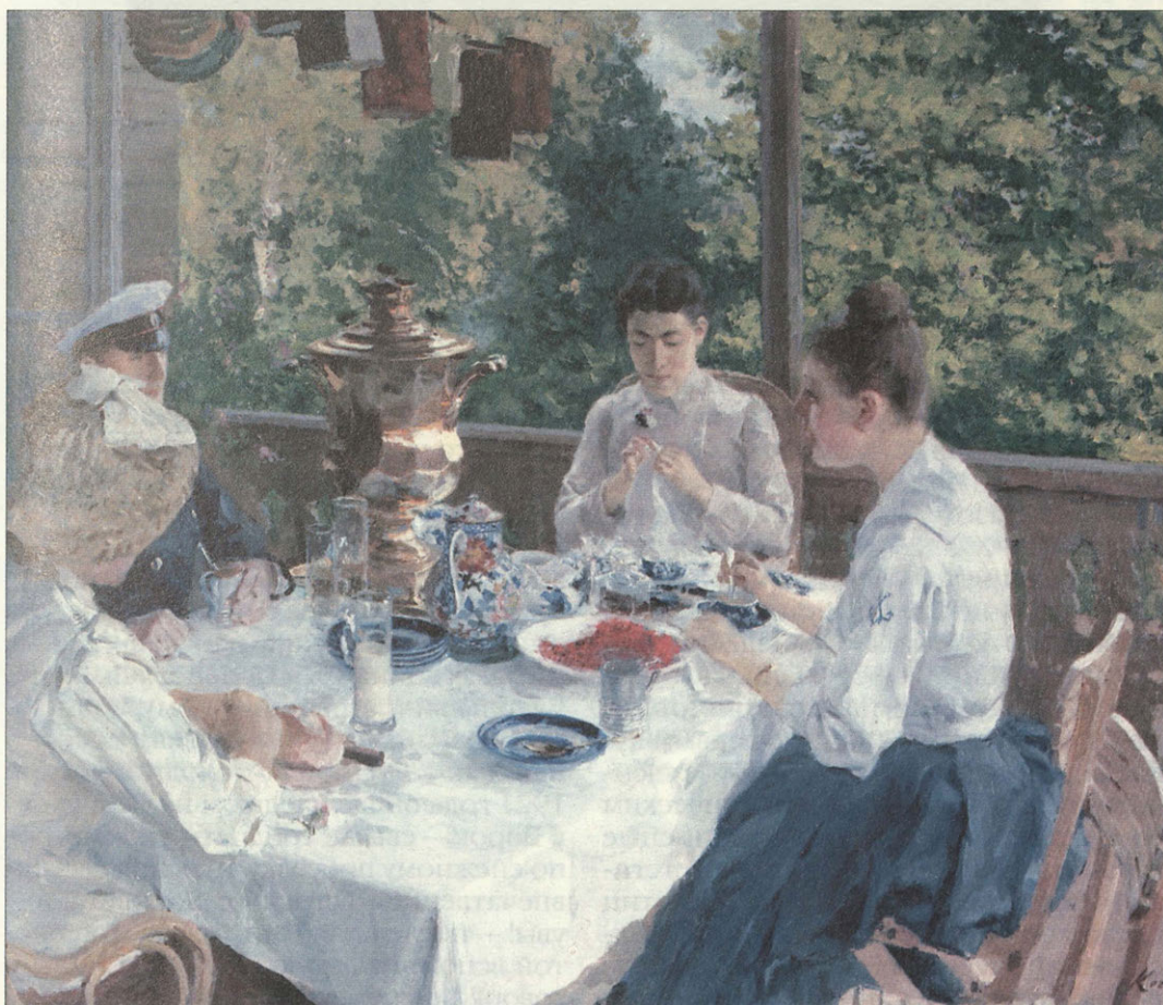
К. Коровин. «За чайным столом». 1888 г. Музей-заповедник В. Д. Поленова