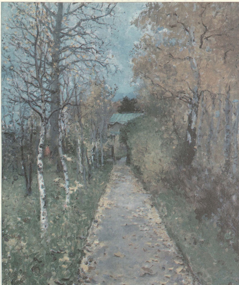
К. Коровин. «Аллея в Жуковке». 1888 г. Музей-заповедник В. Д. Поленова

Недавно в одной из статей под рубрикой «Собрание русской живописи. XX век» в «Огоньке» довелось прочесть: «Существовал ли импрессионизм в русском изобразительном искусстве на рубеже XIX — XX веков? Если говорить о каком-то прямом подражании знаменитым французским мастерам, то его, бесспорно, не было. Некой школы, или организационно оформленного объединения русских импрессионистов тоже не возникало... Но все же первым художником в России, который убежденно и последовательно, с артистическим совершенством развил живописные принципы, перекликающиеся с эстетикой импрессионизма, был Константин Алексеевич Коровин». И мне вспомнился давний рассказ о том, как на одном из первых занятий в натурном классе Мос-