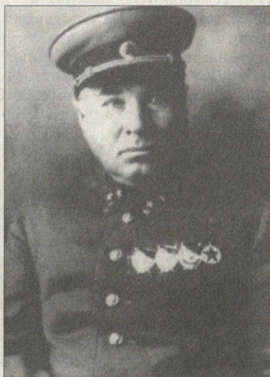
Генерал И.Р.Апанасенко Фото 1940 г.

В Европе запылала война, опасность нависла и с Востока. Поэтому