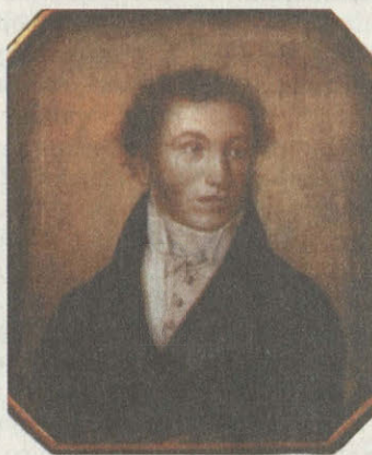
Ж. Вивьен А.С.Пушкин. 1826 г.

На Екатеринодар из Ставрополя вела дорога через Рождественское, Новотроицкую, Новоалександровскую, Темижбекскую станицы вниз по Кубани, через Лабинскую крепость. Эта дорога связывает Екатеринодар с Таманским полуостровом и Крымом. К тому времени появилась экстраспочта, днем и ночью мчались по тракту фельдъегерские тройки, шли войска, снаряжение. «По казенной надобности возили на почтовых превосходно, как нигде в России», — вспоминает чиновник военного ведомства. В Ставрополе находилась крупная поч-