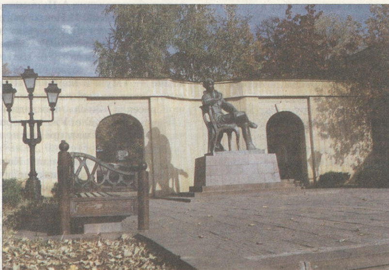
Памятник А.С.Пушкину в Ставрополе

...Кавказ забудет алчной брани глас, Оставит стрелы боевые.