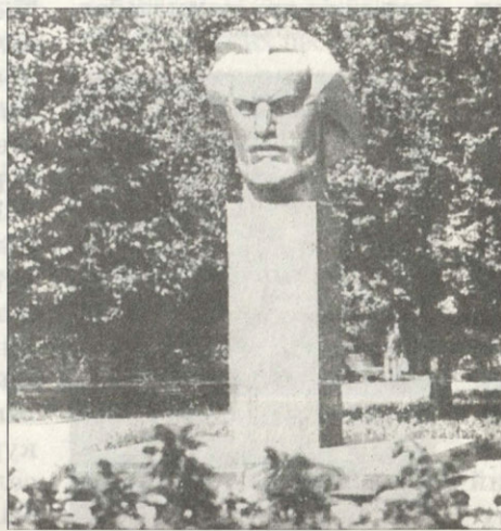
Памятник Г.А.Лопатину в Ставрополе

Нет, Герман Лопатин не легенда. В этом слове есть нечто остановившееся. Он — легендарность, которую невозможно представить вне движения, без устремления к высоте, у которой не бывает предела.