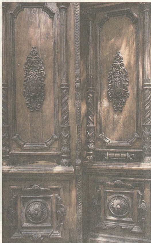
Старинные интерьеры создают особое настроение