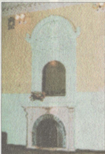
Интерьер одного из залов

Декор тамбура более богат по формам. Филенчатая, резная, темная входная дверь контрастирует со