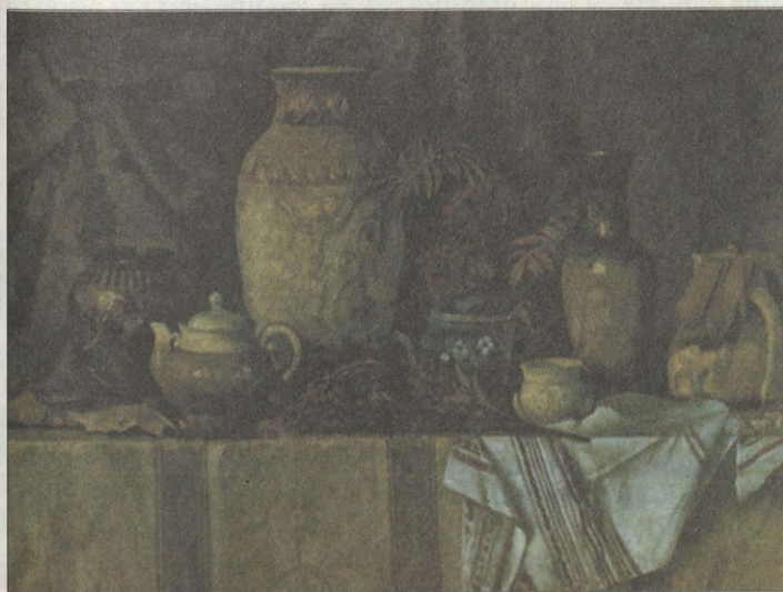
М.Толстиков (1915–2000 гг.) Натюрморт с рябиной

Исчезло всякое уныние. В коридорах появились копии античных скульптур, на стенах — лучшие работы студентов: живопись, графика, работы по дизайну. Все, кто заходит сюда, часто