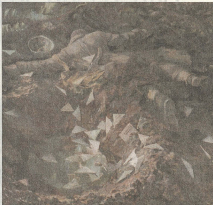
Д.Гущин Полевая почта. 1997 г.