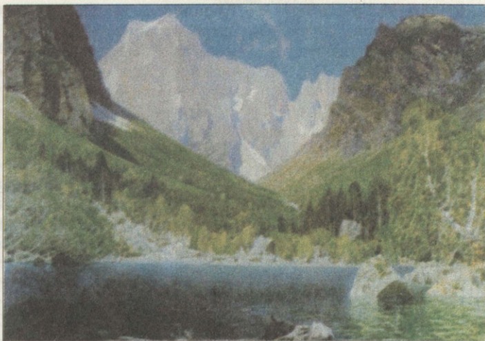
П.М.Гречишкин Бадукское озеро. Теберда