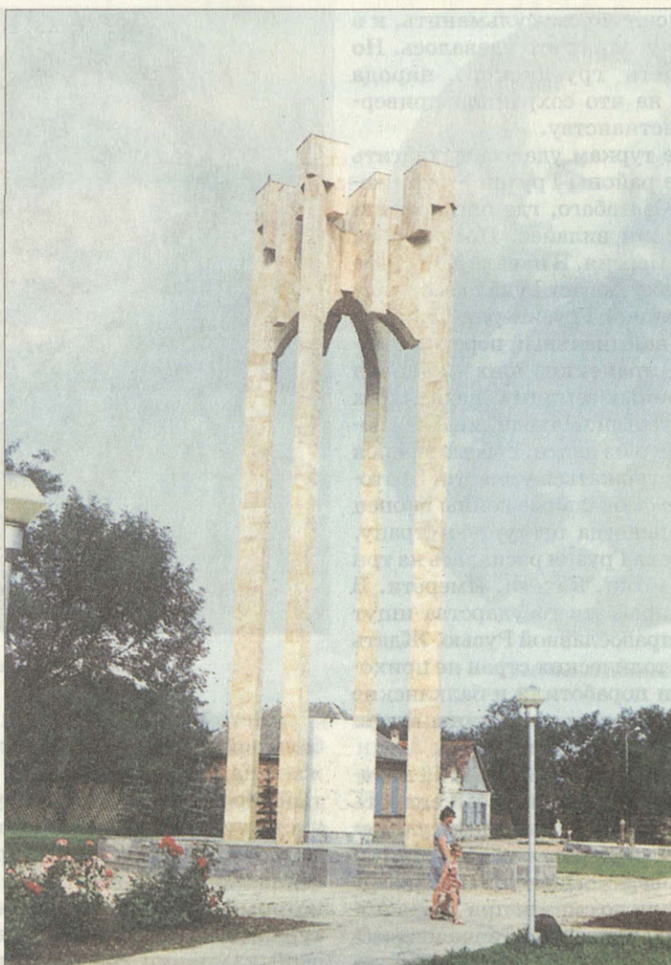
Памятный знак в честь 200-летия подписания Георгиевского трактата

крепость Цхуми (Сухуми) сравнивали с землей. Лишь в IX веке Грузия начала возрождаться. Немаловажными для обретения независимости грузинского народа были контакты с сильным северным соседом — Киевской Русью. Политический союз в то время закреплялся, как правило, брачными связями между царствующими династиями. В 1154 году грузинская царевна Русудан, дочь царя Деметра I, становится женой киевского князя Изяслава Мстиславовича. А в 1185 году дарбази (царский совет) Грузии приглашает русского царевича Юрия, сына Ростово-Суздальского князя Андрея Бого-