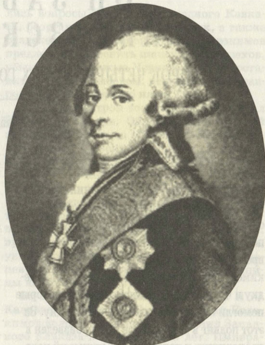
Граф Павел Потемкин

развалинах. Население Кахетии и Картли составляло около 200 тысяч человек.