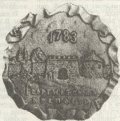
Памятный знак в честь 200-летия Георгиевского трактата

Речь в этих строках из лермонтовской поэмы «Мцыри» идет о знаменитом Георгиевском трактате, объединившем русский и грузинский народы. Этот важный дипломатический документ был подписан в городе Георгиевске 24 июля 1783 года.