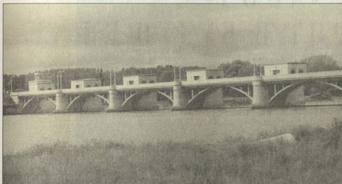
Головная плотина канала на реке Кубань

высотой до 6 метров и длиной полтора километра.