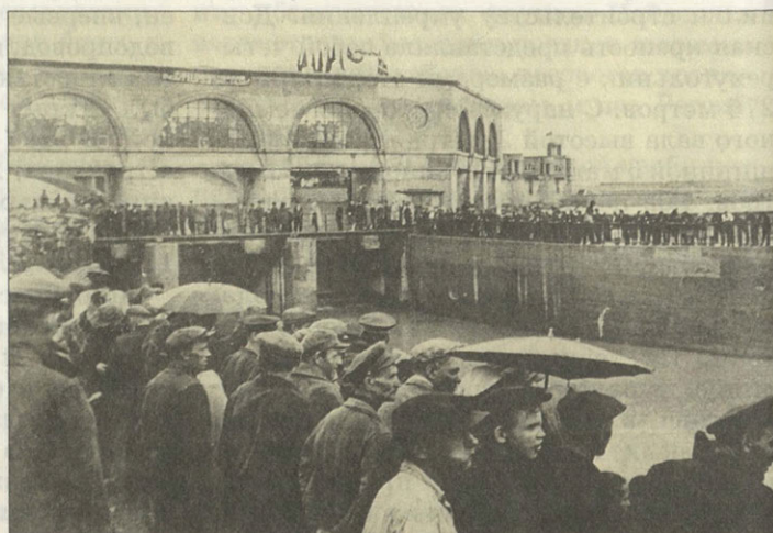
Митинг по случаю пуска канала 1 июля 1948 г.

Построить двойной железобетонный дюкер под рекой Барсучкой, а на 14-м километре соорудить гидроэлектростанцию мощностью 12 тысяч киловатт. В конце канала пре-