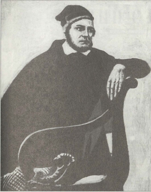
А. И. Герцен. Город Владимир. 1838 г. Портрет работы неизвестного художника

Герцен высоко ценил красоту пейзажа, обрамляющего архитектурный ансамбль древнего Владимира, любил гулять «по прелестным берегам Клязьмы», любовался ночами, как «Владимир спит в садах и горах, разбросанный сам по горам... О, как прелестны окрестности маленького Владимира», — писал он 8 апреля 1838 года Захарьиной. «Вот и лед ломается на Клязьме, и все так живо, живо, солнце радостно светило, а под ногами у меня (я был на горе) толпа народу». В лунные ночи он выходил на Козлов вал смотреть, «как лучи его (месяца) опираются на древний собор Андрея Боголюбского и стелятся по необозримым равнинам».