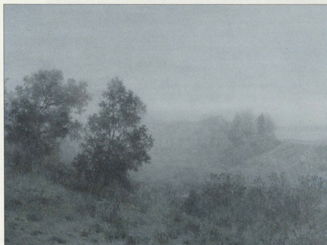
М. Изотов. Туман

теров шло постижение проникновенной лирики русского пейзажа, наполненного одухотворенными человеческими чувствами. Картины теперь писались ими в нежной цветовой гамме, дающей богатство тонов и переходов одного состояния природы в другое. Мягкая палитра способствовала передаче спокойного и созерцательного элегического настроения, сдержанного, но глубокого по эмоциональной окраске. До середины пятидесятих годов шел напряженный процесс познания богатейшего художественного опыта прошлого, который постепенно вырисовывал собственный путь в пейзаже.