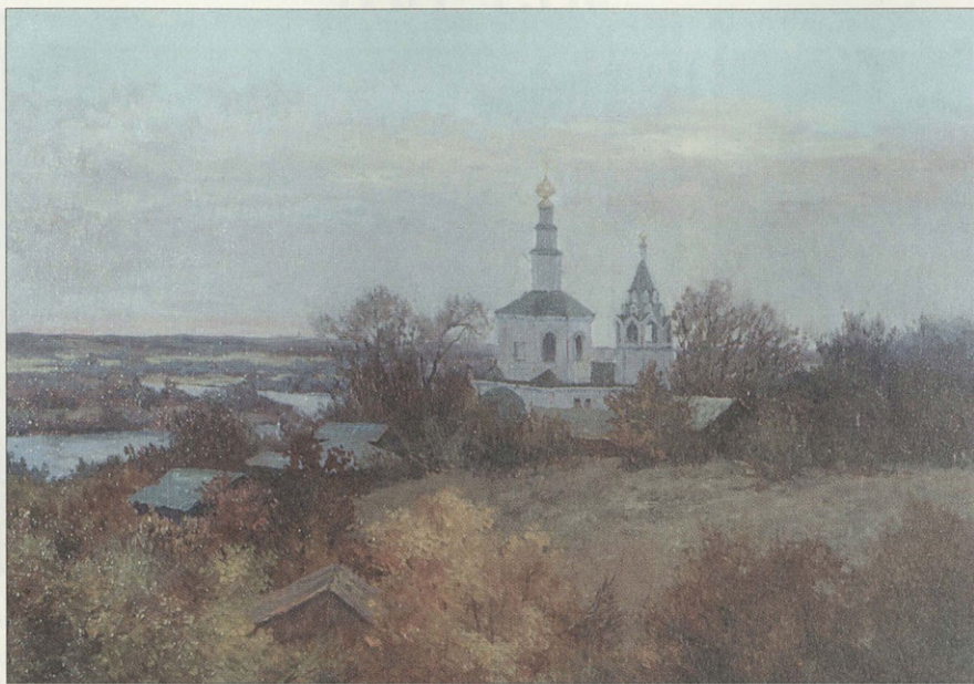
О. Модоров. Николо-Галейская церковь во Владимире