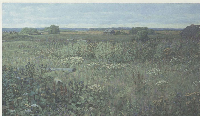
А. Кувин. Покинутая деревня