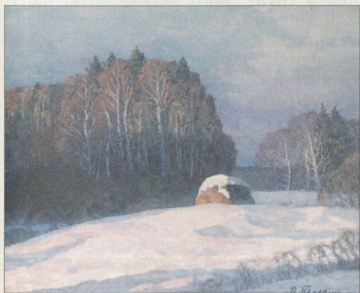
В. Рузин. Владимир вечерний