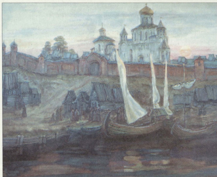
В. Кокурин. В Суздальском кремле