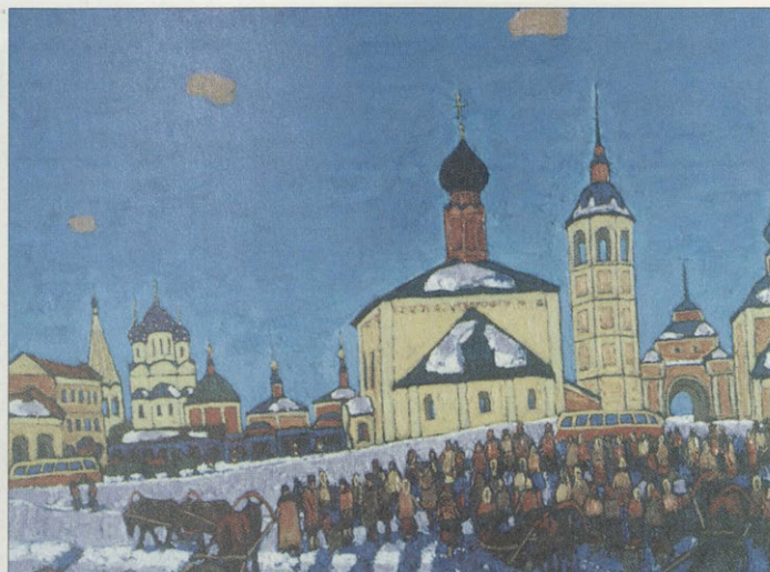
К. Бритов. Воскресный Суздаль. 1983