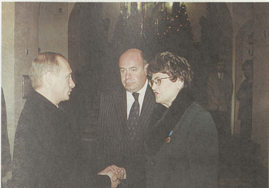
Президент России В.В. Путин, министр культуры М.Е. Швыдкой и А.И. Аксенова

Российской Федерации за сохранение и возрождение культурного наследия, творческое развитие музейного дела.