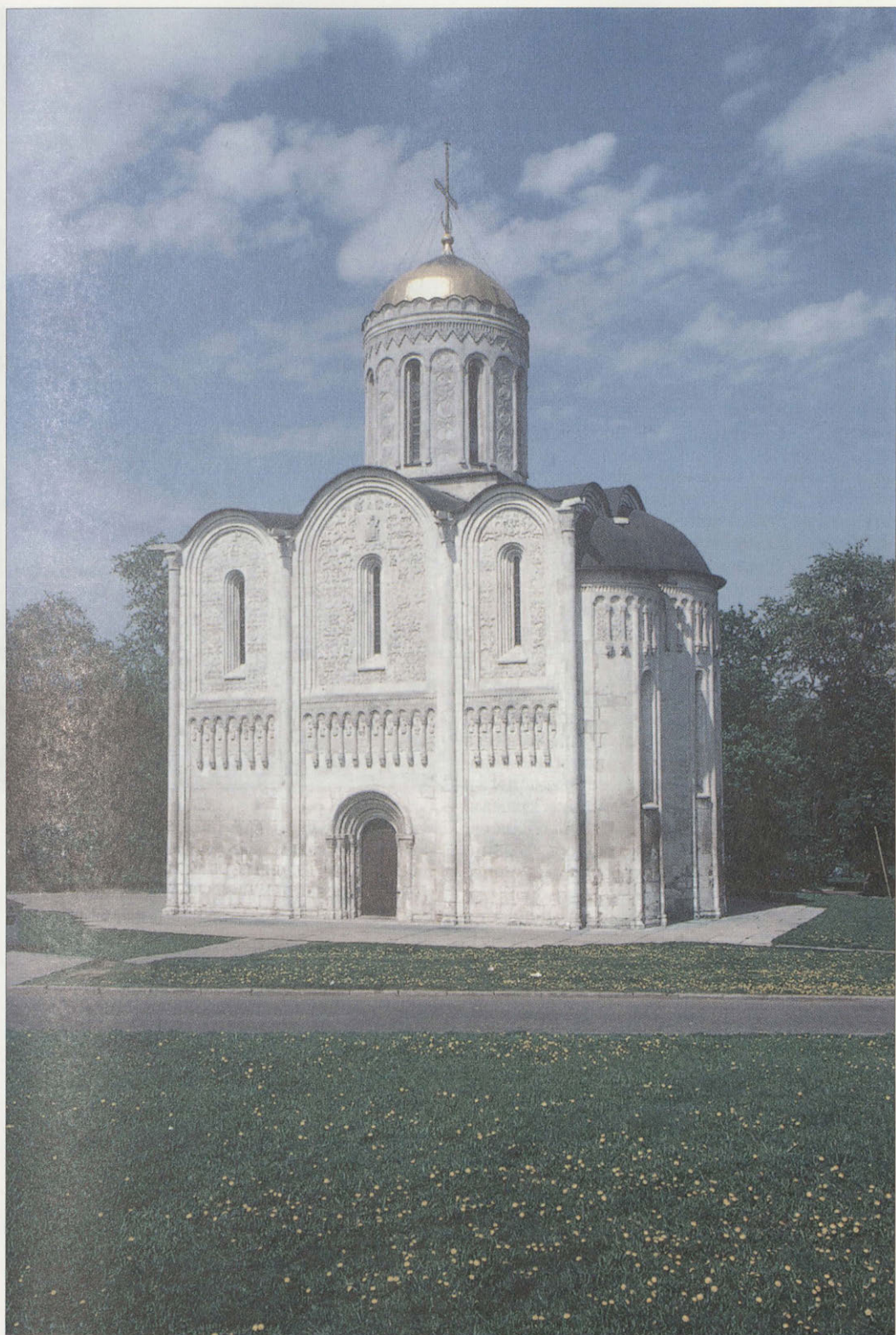
Дмитриевский собор. XII в.