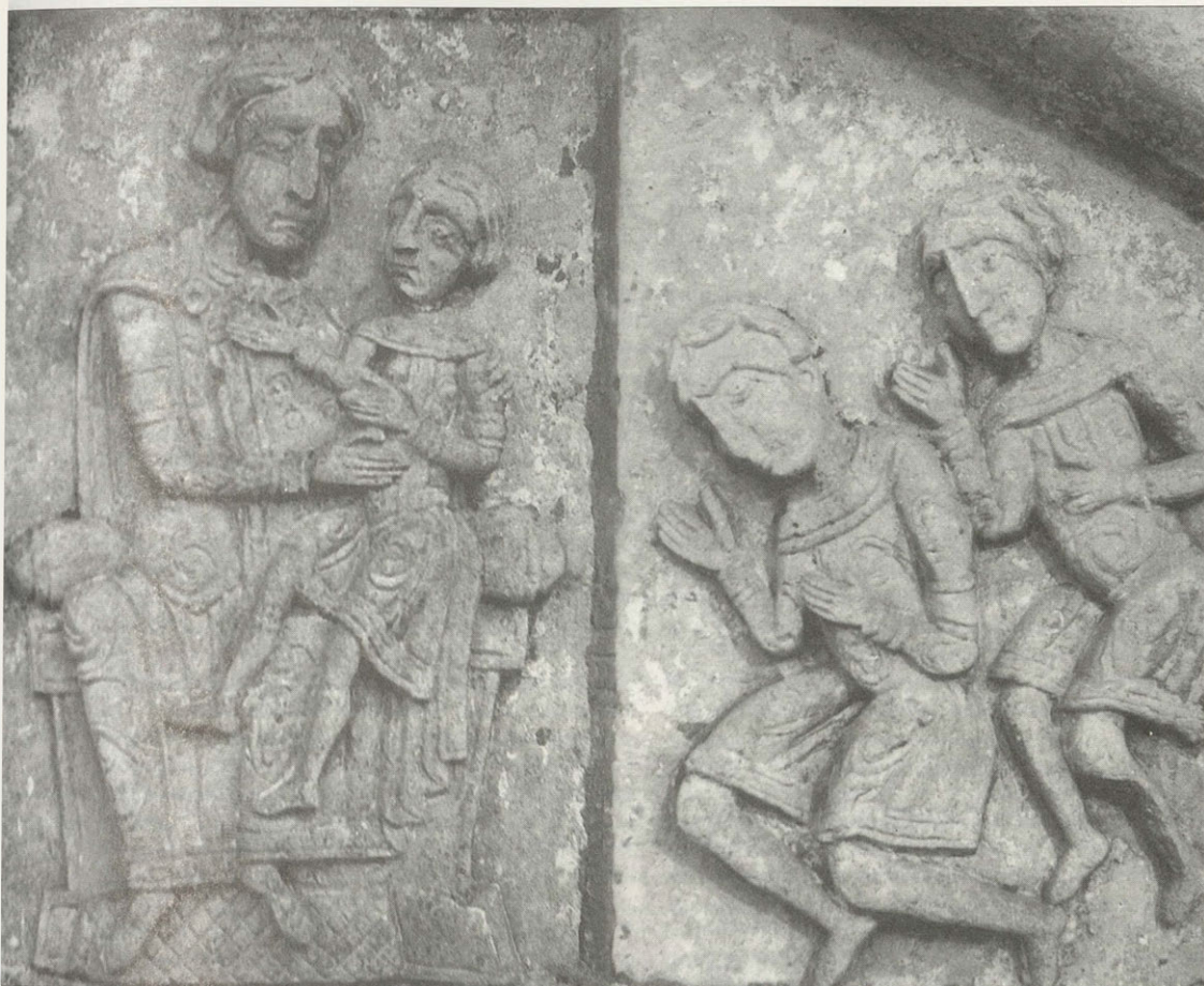
«Большое Гнездо» — великий Владимиро-Суздальский князь Всеволод III с сыновьями, будущими великими князьями: Ярославом, Юрием, Константином, Святославом и маленьким Владимиром — первым московским князем

ный контраст натурализма и схематизма позволяет говорить о «собственно портрете», то есть изображении по преимуществу лиц, ликов. При этом весь рельеф остается декоративным, «по-соборному» монументальным, по-своему символичным. Древняя Русь оставила здесь единственный в своем роде скульптурный «семейный портрет», хотя он и запечатлел только мужскую (воинскую) часть семьи Всеволода.