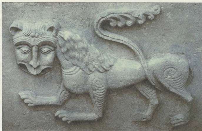
Лев. Рельеф Дмитриевского собора во Владимире. XII в. После реставрации 1999

«Большое Гнездо», его роковые камни хранят тайны своего времени. Еще в XIII веке исполнились все их странные «предназначения». Они сохранили до нашего времени память о великом Всеволоде и его великих сыновьях, а также о первом князе Москвы, о зарождавшейся в начале XIII века Московской Руси. В России вообще нет более символичного, более выдающегося, более драгоценного скульптурного памятника, чем «Большое Гнездо». Жаль только, что неведом его главный художник-резчик — мудрец и провидец.