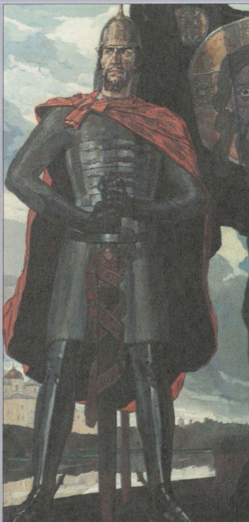
Александр Невский. Художник П. Корин. 1942

Кто с мечом к нам придет, от меча и погибнет. На том стоит и стоять будет Русская Земля