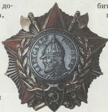
Орден Александра Невского

«Советская Россия», 1 июня 2000 г. Печатается в сокращении.