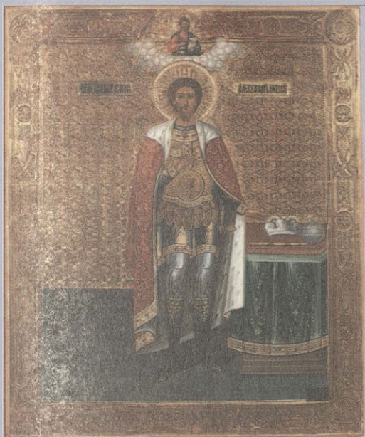
Икона «Александр Невский». XIX в. Мстера