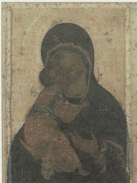
Андрей Рублев. Богоматерь Владимирская. 1395-1411

Исполненное мужества и смысла, особое отношение к смерти давало силы жить, вдохновенно творить в готовности ежечасно принять предначертанное. Они писали фрески, и, быть может, тот свет, та всеобъемлющая ласковость и теплота, которые до сих пор поражают нас в этих тихих лицах, и были ответом на великое испытание смертью. Они, надеющиеся сами, давали теперь своим художеством эту надежду другим. Да и как иначе чуткая, любящая душа Андрея могла откликнуться на человеческие страдания? «В совершенном, в художестве, в мужестве...»