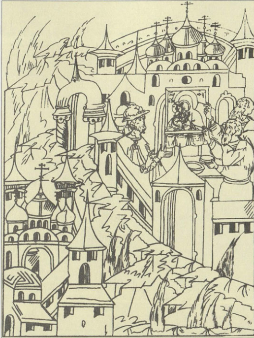
Андрей Рублев и Даниил Черный за работой в Успенском соборе во Владимире. Остермановский том Лицевого списка «Жития Сергия». XVI в.

Конец мая и лето 1408 года были солнечными, сухими. Стояла редкая жара при сильном южном ветре. Горячие суховеи рождали бури. При такой погоде легко на-