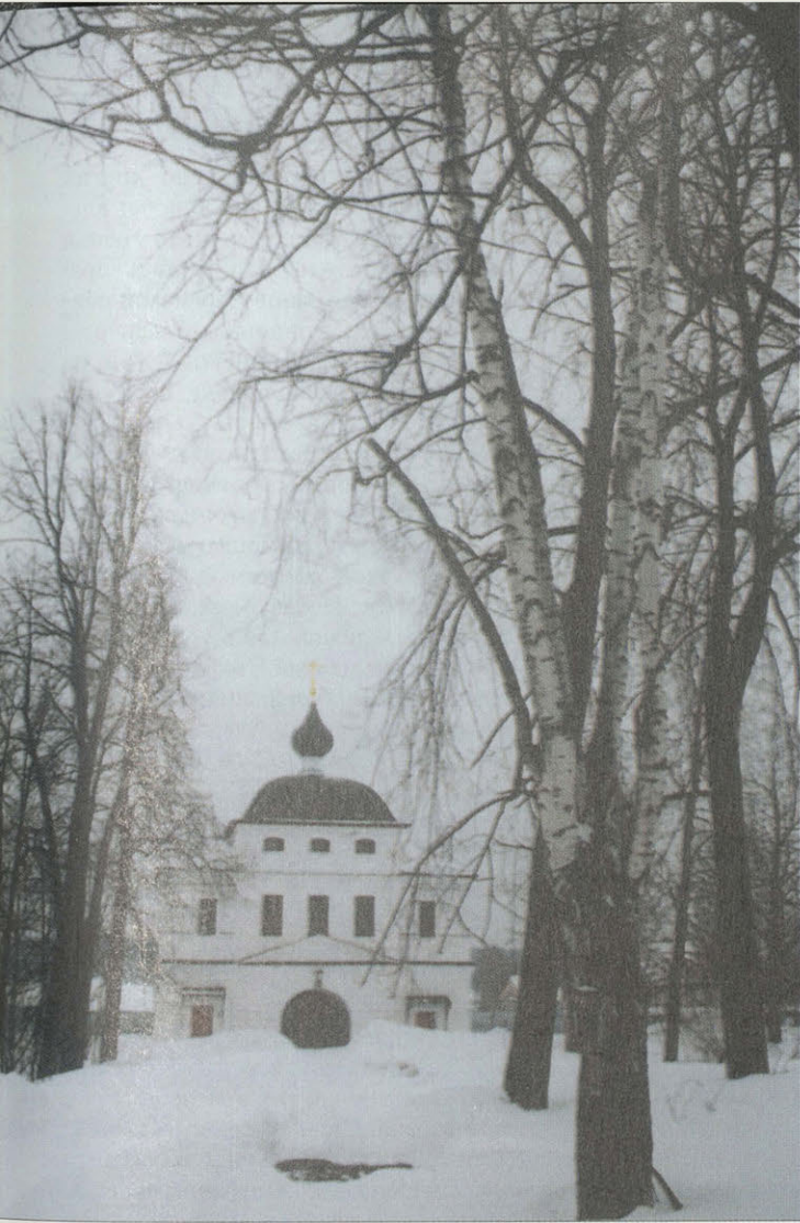
Надвратная церковь Сергия Радонежского